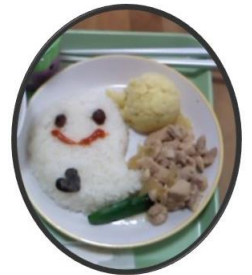
例・ハロウィンメニュー

こどもの「好奇心」、「好きなる」の気持ちを大切に英語、体操、リトミックのカリキュラムも実施しています。それぞれのカリキュラムは専門講師によるもので、それぞれの年齢に応じて、どの子も楽しく行っています。