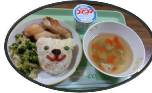
例・お誕生日会メニュー

●月に一度の行事食や誕生日会の日などは、特別メニューをご用意し、よい食事を楽しめるように工夫しています。